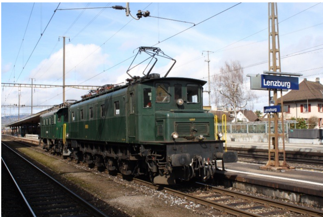
Transfert de la Be 4/4 171. Arrêt à Lenzburg

Après le contrôle technique approfondi de 2009, l'Ae 6/8 ressortira comme neuve avec cette remise en peinture.